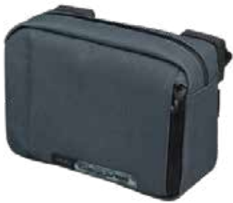
PRBA0065 把手包 2.5L