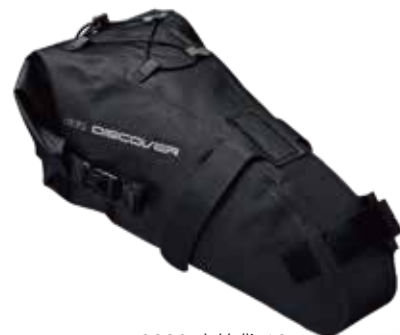
PRBA0080 座管袋 10L