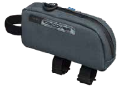
PRBA0063 上管包 0.7L