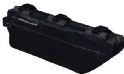
PRBA0061 車架包 5.5L