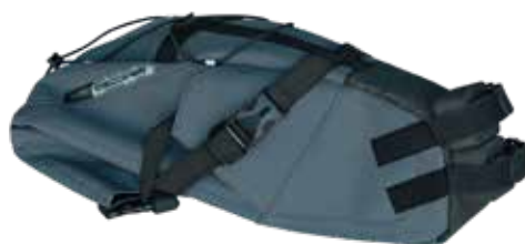
PRBA0053 座管袋 15L