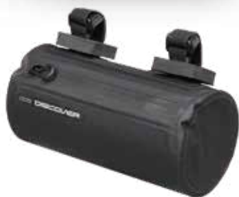
PRBA0066 把手包 2L