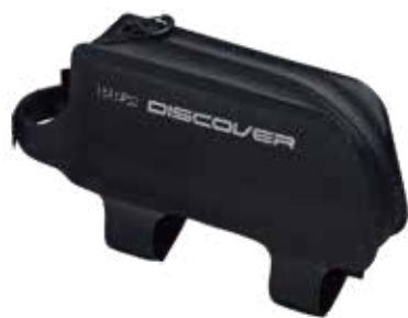
PRBA0060 上管包 0.7L