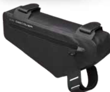
PRBA0069 車架包 2.7L