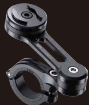
摩托車圓管固定支架