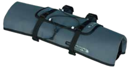
PRBA0052 把手包 8L