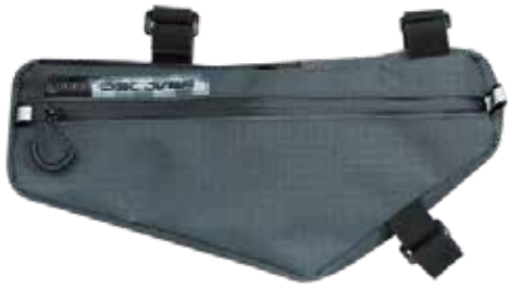
PRBA0056 車架袋 2.7L