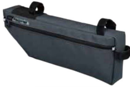
PRBA0064 車架包 5.5L