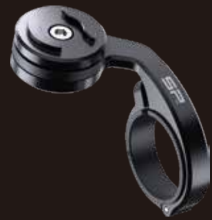
自行車把手固定支架